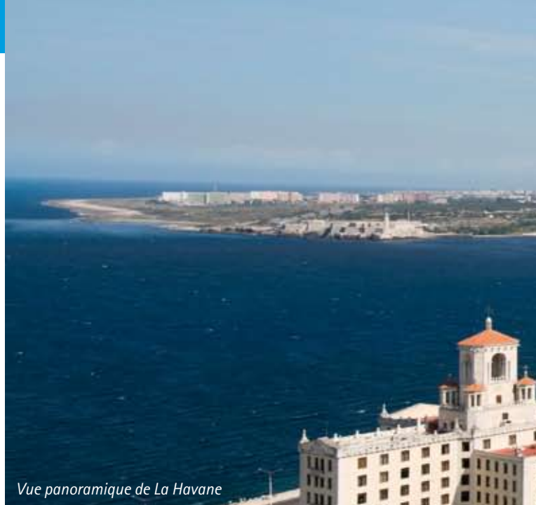
Vue panoramique de La Havane

C uba, la plus grande des îles des Antilles avec 7000 km de côtes, est un archipel constitué par une île principale du même nom ; elle possède 289 plages de sable et 1600 îles et îlots appelés cayos. Ensoleillée plus de 200 jours par an, cette île au climat si agréable permet de profiter des plages en toutes saisons. La diversité des paysages, l'éclat des couleurs et la variété de ses fruits vous emporteront dans un havre de paix qui vous assurera évasion et détente. Ce circuit vous permettra de découvrir en profondeur la partie occidentale de l'île avec La Havane, Pinard el Rio, Cienfuegos et Trinidad, pour terminer avec deux nuits en balnéaire à Varadero.