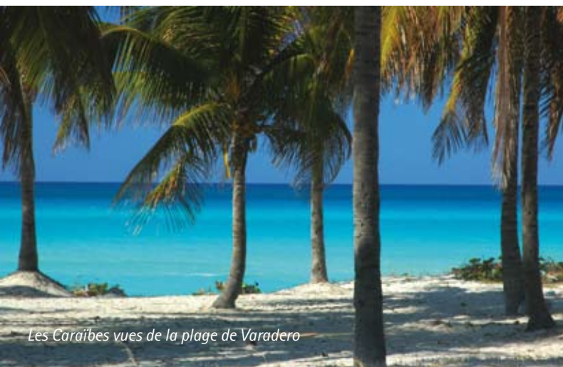
Les Caraïbes vues de la plage de Varadero

Après le petit déjeuner, vous partirez en direction de Santa Clara, où se trouve le Mémorial du Che que vous visiterez, ainsi que le train blindé qui a déraillé et a permis la victoire des résistants. Après Santa Clara, vous monterez dans un petit train à vapeur de 1915, dans le village de Remedios et partirez à la découverte de l'arrière pays et de ses champs de canne à sucre. Déjeuner et visite dans une ferme cubaine et découverte de l'exploitation rurale (porcs, vaches, volaille et plantations). Continuation et visite d'une ancienne sucrerie (en train ou car). Continuation pour Varadero et ses superbes plages. Installation au Club Amigo****.