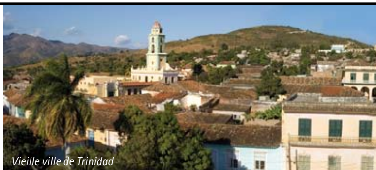
Vieille ville de Trinidad

Petit déjeuner buffet puis route pour Pinar Del Rio. Baptisée province de « Pinard el Rio » dès la fin du XIII e siècle en raison de ses nombreux bois de pin ; c'est la plus occidentale du pays. Elle possède la meilleure terre à tabac du monde. Les Français au début du XX e siècle introduisent la culture du café. Visite d'une fabri-