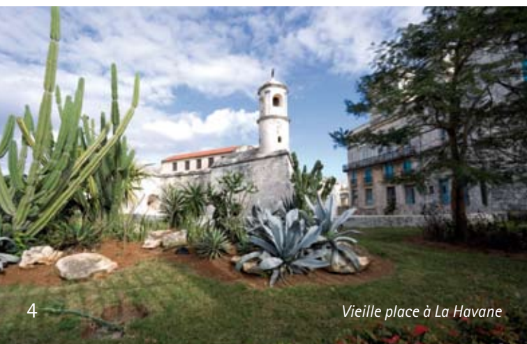
Vieille place à La Havane

Petit déjeuner. Vous commencerez votre journée par une promenade dans le jardin botanique de la ville, abritant de nombreuses essences tropicales, et notamment des palmiers. Départ pour la ville de Trinidad, petite ville de 50 000 habitants, qui a gardé ses rues pavées, ses toits de tuiles et ses grandes fenêtres protégées par de très belles grilles. Parcs et belles demeures se succèdent au centre de la cité endormie sous le soleil généreux du centre de Cuba... En raison de ses trésors culturels, l'Unesco a inscrit Trinidad au registre des grands héritages du monde